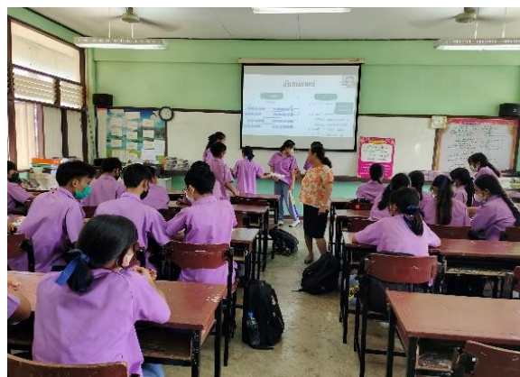
ภาคผนวก ๑๗ ฝึกความรับผิดชอบในการทำกิจกรรมรู้จักการเป็นผู้นำและผู้ตามที่ดีมีความมั่นใจในตนเองในการนำเสนอผลงาน