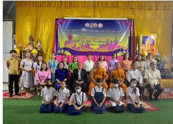
ภาคผนวก ๒๒ เป็นผู้ที่มิถุมิรู้ ภูมิธรรม เป็นแบบอย่างที่ดีทั้งภายในและภายนอกโรงเรียน จึงได้รับ เชิญเป็นคณะกรรมการตัดสินประกวดพูดบรรยายธรรมระดับจังหวัดทุกปี