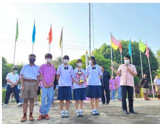
ภาคผนวก ๑๖ แสดงความสามารถพิเศษ และการได้แสดงศักยภาพรายบุคคลของนักเรียนในที่ปรึกษา