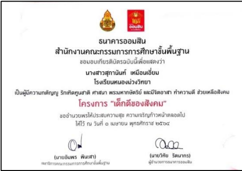
ภาคผนวก ๒๔ แสดงภาพนักเรียนได้รับการยอมรับระดับประเทศ