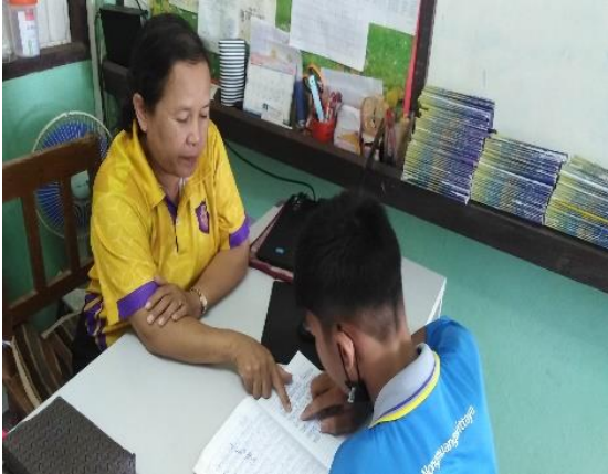
ภาคผนวก ๒๐ แสดงความรักความห่วงใยในการติดตามการอ่านของนักเรียนชุมนุม ด้วยนวัตกรรม กอด กล่อม เกลา เขาเรียกเราว่าแม่ ให้มาอ่านหนังสือทุกวันในช่วงพักกลางวัน