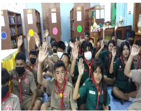
ภาคผนวก ๑๘ ให้ความรู้ให้คำแนะนำ ให้อู้จักแสดงความคิดเห็น ส่งเสริมความเป็นประชาธิปไตย โดยใช้ นวัตกรรม กล่อมและเกลา