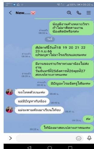
ภาคผนวก ๖ ติดตามพฤติกรรมโดยให้คำแนะนำ ช่วยเหลือขอความร่วมมือจากผู้ปกครอง