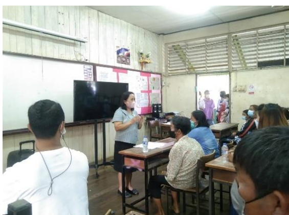
ภาคผนวก ๒๑ ขอความร่วมมือกับผู้ปกครองในการให้ร่วมกันวิเคราะห์ปัญหาเพื่อร่วมกันแก้ปัญหา นักเรียนให้เติบโตเป็นคนดี คนเก่ง โดยใช้นวัตกรรมกอด กล่อม เกลา เขาเรียกเราว่าแม่