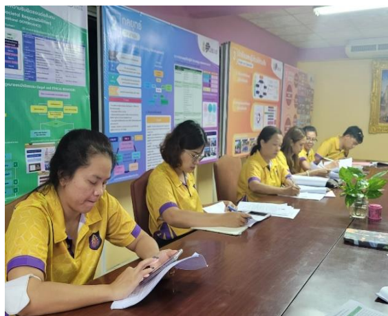
ภาคผนวก ๑๓ แสดงการนำกระบวนการของนวัตกรรมขยายผลสู่คณะครูในโรงเรียน