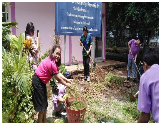
ภาคผนวก ๑๑ ปฏิบัติงานร่วมกันให้มีความรับผิดชอบให้กับนักเรียนในวิชาที่สอน ให้รู้จักการทำความสะอาดบริเวณต่างๆของโรงเรียน