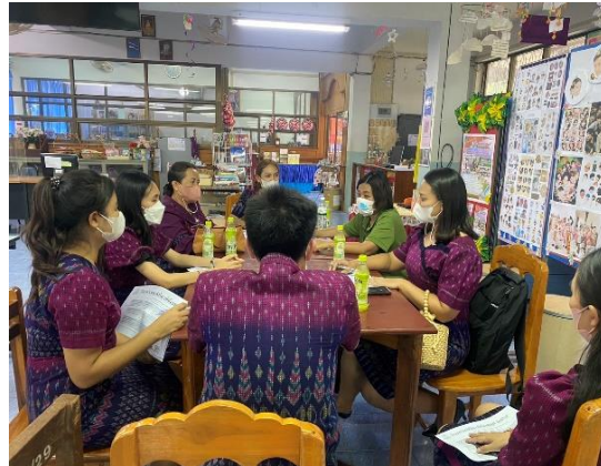
ภาคผนวก ๑ แสดงการสำรวจ วิเคราะห์และคิดหาวิธีแก้ปัญหา โดยการศึกษาเอกสารที่เกี่ยวข้อง