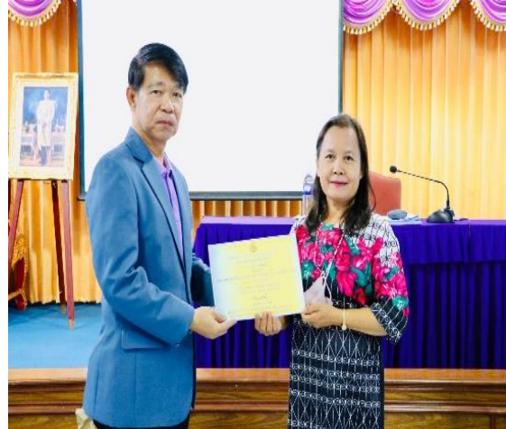
ภาคผนวก ๒๔ แสดงภาพการยอมรับของโรงเรียน