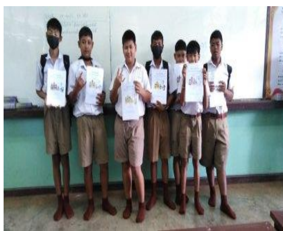
ภาคผนวก ๘ ติดตาม ช่วยเหลือส่งเสริมแก้ปัญหาการอ่านโดยใช้ นวัตกรรม กอด กล่อม เกลา เขาเรียกเราว่าแม่