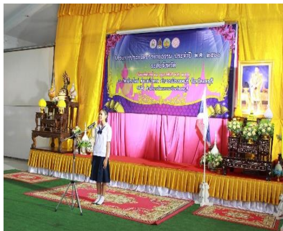
ภาคผนวก ๑๙ แสดงผลความสำเร็จ นักเรียนในรายวิชาที่สอนมีความสามารถพิเศษเชิงประจักษ์ และได้แสดงศักยภาพ