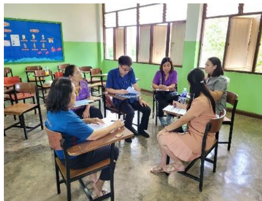
ภาคผนวก ๑๒ แสดงการนำกระบวนการของนวัตกรรมขยายผลสู่คณะครูในโรงเรียน