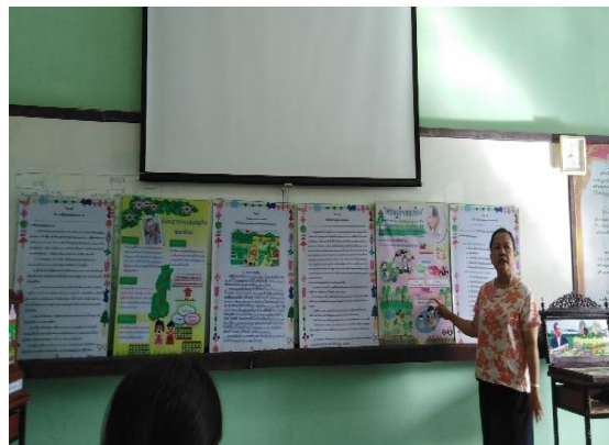
ภาคผนวก ๑๐ น้อมนำศาสตร์พระราชาลักษณ์การทรงงานตามแนวพระราชดำริของพระบาทสมเด็จพระบรมชนกาธิเบศร มหาภูมิพลอดุลยเดชมหาราช บรมนาถบพิตร มาประยุกต์ใช้ คือ “เข้าใจ เข้าถึง พัฒนา” ซึ่งถือเป็นวิธีการแห่งศาสตร์พระราชາเพื่อการพัฒนาที่ยั่งยืน