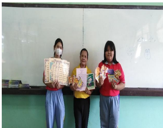
ภาคผนวก ๗ ติดตาม ช่วยเหลือส่งเสริมแก้ปัญหาการอ่านโดยใช้ นวัตกรรม กอด กล่อม เกลา เขาเรียกเราว่าแม่