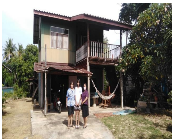
ภาคผนวก ๕ เยี่ยมบ้านนักเรียนเพื่อทราบปัญหาและนำมาเป็นข้อมูลในการแก้ปัญหา