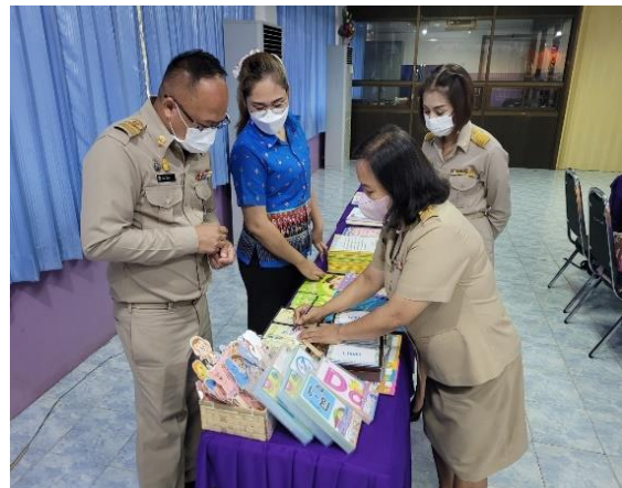
ภาคผนวก ๒๓ เผยแพร่การแก้ปัญหาการอ่าน การเขียนของนักเรียนชุมนุม โดยใช้นวัตกรรม รับผิดชอบ มีชัยชนะ ลูก นวัตกรรม กอด กล่อม เกลา เขาเรียกเราว่าแม่