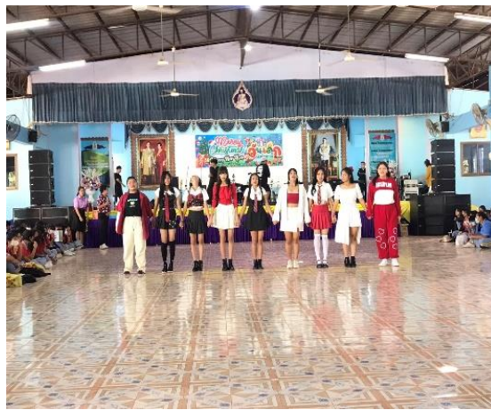
ภาคผนวก ๒ ส่งเสริมสนับสนุนนักเรียนในที่ปรึกษาให้เข้ากิจกรรมตามความถนัดและตามความสามารถ