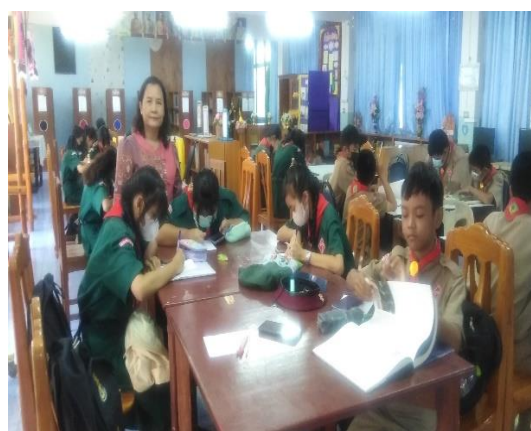
ภาคผนวก ๙ ปลุกจิตสำนึกให้มีความรับผิดชอบให้กับนักเรียนในวิชาที่สอน โดยใช้ห้องสมุดเป็นแหล่งเรียนรู้