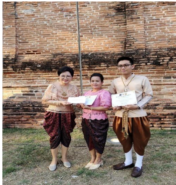
ภาคผนวก ๒๔ แสดงภาพการยอมรับการใช้วัฒนธรรม