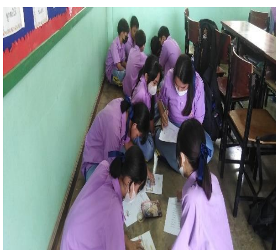
ภาคผนวก ๑๕ ฝึกความรับผิดชอบในการทำกิจกรรมร่วมกับเพื่อนๆด้วยความตั้งใจและมีความสุข