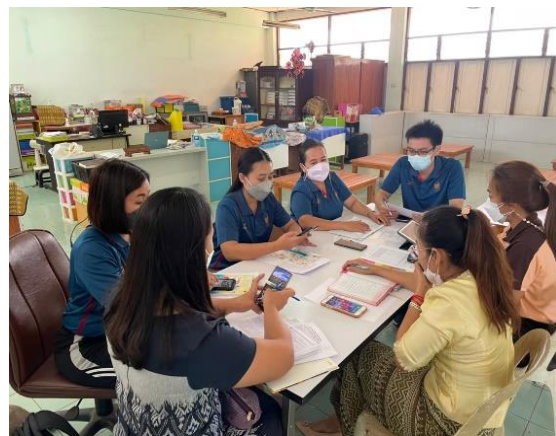
ภาคผนวก ๔ แสดงการหาค่าประสิทธิภาพนวัตกรรม ทบทวน ขอคำแนะนำและปรับปรุงพัฒนา