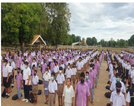
ภาคผนวก ๑๔ ฝึกความรับผิดชอบในการมาเข้าร่วมกิจกรรมให้ตรงเวลาและทำกิจกรรมด้วยความตั้งใจ