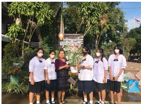
ภาคผนวก ๓ ให้นักเรียนในที่ปรึกษาร่วมทำความดี รู้จักเสียสละและแบ่งปันในกิจกรรมการทอดผ้าป่าการกุศลของโรงเรียน